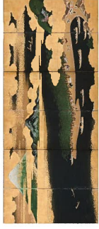
作者不詳「富士三保清見寺図屏風」六曲一双 江戸時代(17世紀)

画中に、徳川家康や久能山東照宮を描いた現存唯一の作例である、新発見「富士三保清見寺図屏風」を、その成立の過程と史的意義を明らかにする最新の研究成果とともに初公開します。また、旧将軍家である徳川記念財団に伝来した作品を中心に、近年新たな知見が加えられた家康の肖像画なども合わせて紹介します。