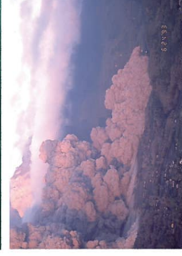
上:三宅島1983年噴火で流出した溶岩 (記録 昭和58年三宅島噴火災害) 東京郡、1985) 下:雲仙普賢岳1993年噴火で発生した火砕流