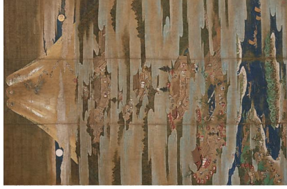
前期:7月10日(土)～8月9日(月) 後期:8月14日(土)～9月12日(日) ※8月10日～13日は原形替のため観覧いただけません。 ※前期と後期で一部展示作品が異なります。

浅間大社と村山興法寺に伝来した資料を中心に、富士山表口の歴史と信仰について紹介します。当センターと富士宮市による初めての共催展で、文化財修復を行った絹本着色「富士曼荼羅圖」(国指定重要文化財本)を初公開します。