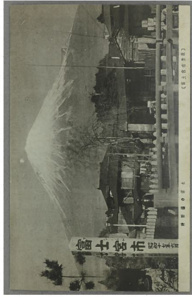
絵はがき「初ぎ見の嶺 富士宮市」(5枚1組)より「神中嶋の富士」 (発行時期 大正7年～昭和8年)