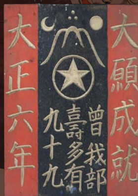
板マネキ (スタールオリジナルデザイン)