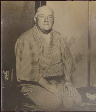
フレデリック・スタール