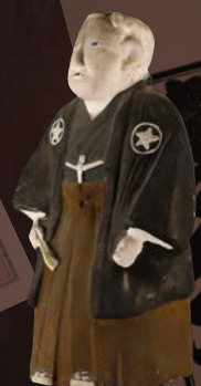
稲畑作り御札博士人形