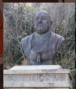
フレデリック・スタール博士銅像 (東洋民俗博物館)