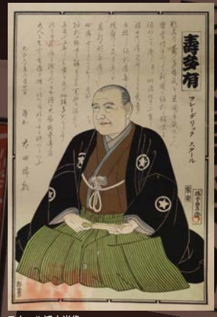
スタール博士肖像

ニューヨーク州オーバーン市に生まれる。1882年にロチェスター大学で学位を得て、1885年にラファイエット大学で地質学における博士号を取得、アメリカ自然史博物館 (AMNH) で学芸員として働く。明治37年 (1904) 2月にアイヌ研究のため初来日、以後昭和8年 (1933) まで16回に及んだ。同年8月に東京で他界。ベルギーとイタリアから勲章を受けられ、日本からは瑞宝章が授与された。1922年にはシカゴ大学で富士山に関する展示会を開催している。自ら山頂へも5回登山しているが、全て静岡県小山町の須走口の犬米谷を定宿とし登山したものである。スタールと須走地区の関係は深く、死後に慰霊碑が建てられ、遺言により遺骨も埋葬されている。親道家であったスタールの日本研究は幅広く、富士講のほか日本に来るきっかけとなったアイヌ、松浦武四郎、なぞなど。絵解き、ひな祭り、祭社の山車、河童信仰、納札、看板、達磨、碁、将棋、寒祭りなどである。特に納札に関して自分の名をもじった「寿多有」と刷られた納札 (千社札) を日本各地に持ち歩き、神社仏閣に貼ってまわったとされる。この行為がスタールを「お札博士」と呼ばれる所以となった。