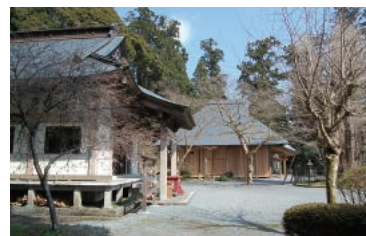
富士山興法寺（大日堂・村山浅間神社）