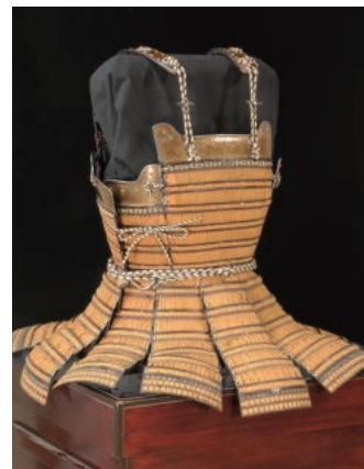
鉄板札紅糸威五枚胴具足 静岡県指定文化財 富士山本宮浅間大社蔵