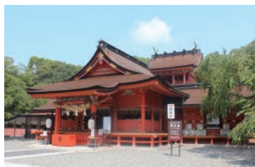
富士山本宮浅間大社

かつて富士山西南麓の表口（大宮・村山口登山道）から富士山頂を目指した参詣者（道者）たちは、大宮の富士山本宮浅間大社と村山の富士山興法寺（大日堂・村山浅間神社）を拠点に信仰登山を行っていました。このふたつの拠点は古くから権力者の保護を受け、発展していきました。今回の企画展は、この浅間大社と興法寺の歴史と信仰をテーマに、静岡県富士山世界遺産センターと富士宮市教育委員会が共同開催する初めての企画展となります。