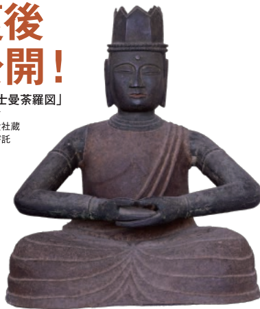
大日如来坐像（大頂寺蔵）

絹本着色「富士曼荼羅図」 国指定重要文化財 富士山本宮浅間大社蔵 静岡県立美術館寄託