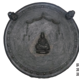
銅造虚空蔵菩薩像懸仏 富士宮市指定文化財 富士山本宮浅間大社蔵