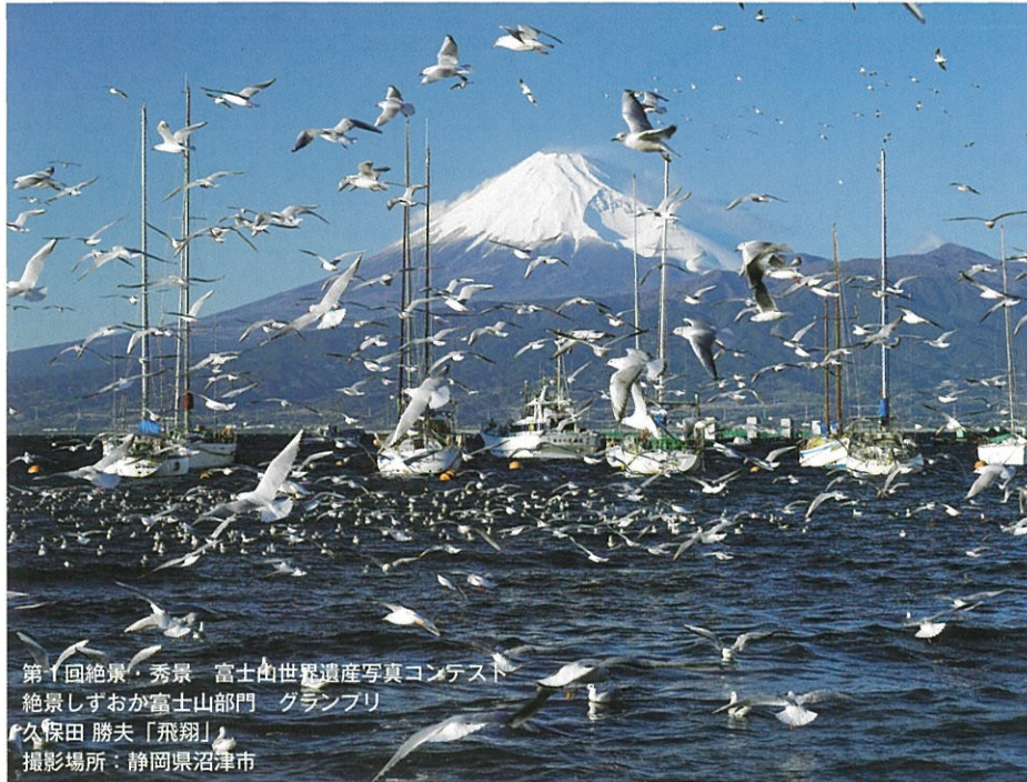
第1回絶景・秀景 富士山世界遺産写真コンテスト 絶景しずおか富士山部門 グランプリ 久保田 勝夫「飛翔」 撮影場所：静岡県沼津市