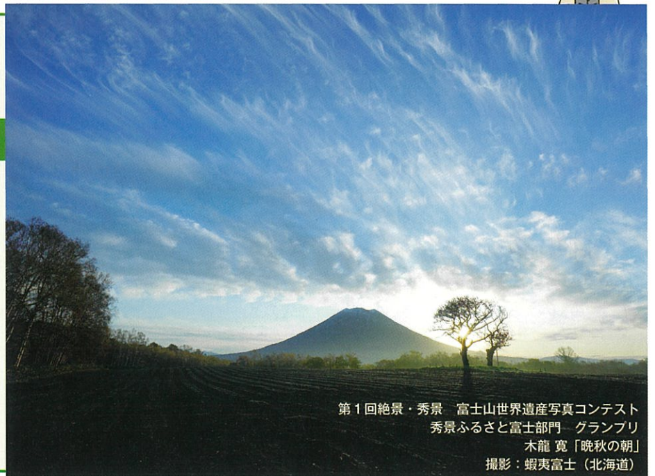
第1回絶景・秀景 富士山世界遺産写真コンテスト 秀景ふるさと富士部門 グランプリ 木龍 寛「晩秋の朝」 撮影：蝦夷富士(北海道)