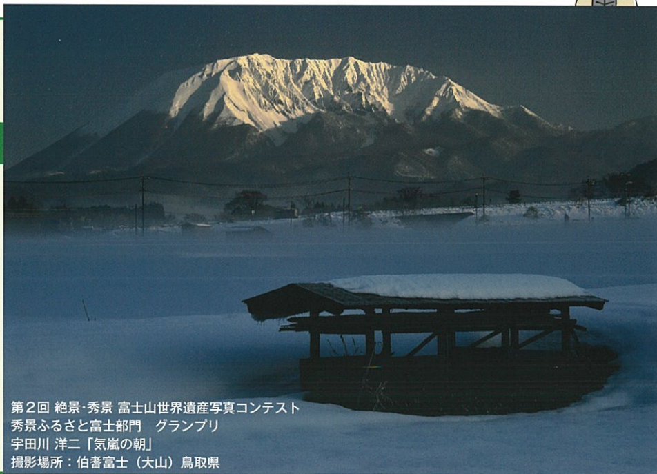
第2回 絶景・秀景 富士山世界遺産写真コンテスト 秀景ふるさと富士部門 グランプリ 宇田川 洋二「気嵐の朝」 撮影場所：伯耆富士(大山) 鳥取県