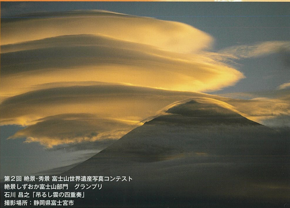
第2回 絶景・秀景 富士山世界遺産写真コンテスト 絶景しずおか富士山部門 グランプリ 石川 昌之「吊るし雲の四重奏」 撮影場所：静岡県富士宮市