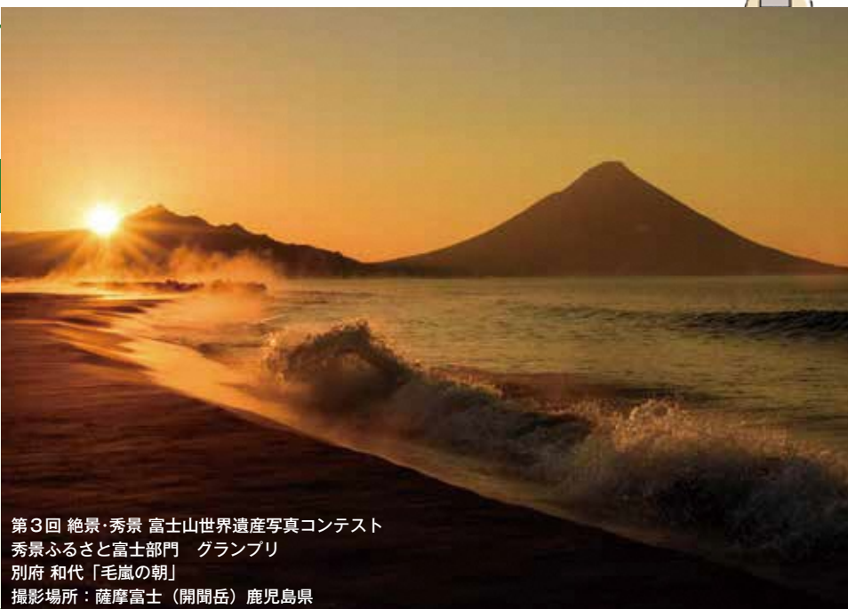
第3回 絶景・秀景 富士山世界遺産写真コンテスト 秀景ふるさと富士部門 グランプリ 別府 和代「毛嵐の朝」 撮影場所：薩摩富士(開聞岳) 鹿児島県