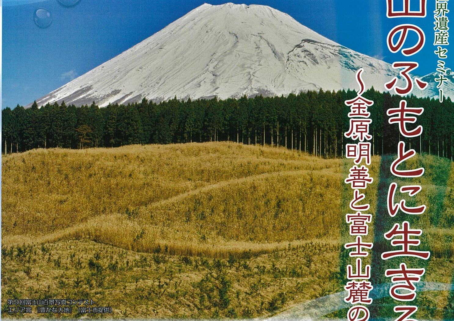
第9回富士山百景写真コンテスト エリア賞 「豊かな大地」

東アジア 文化都市 2023 静岡県 Culture City of East Asia 2023 SHIZUOKA