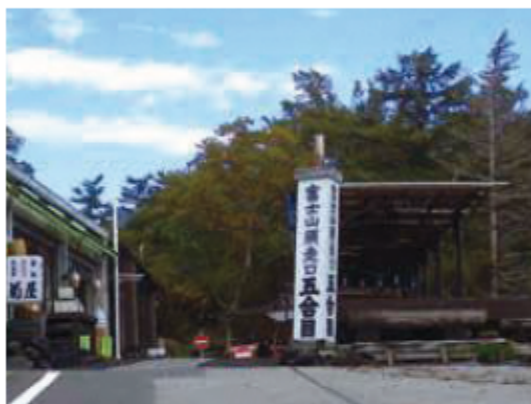
富士山須走口登山道 あざみライン新五合目

富士山の各登山道にある「合目」の標記。各登山道の各合目の標高は同じではないことを知っていますか？また同じ登山道でも時代によって各合目は付け替えられているのです。謎!? の多い富士山の「合目」のハナシ、誰かにきくと話したくなるトリビアを学びましょう!!