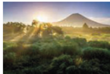
絶景しずおか富士山部門グランプリ 「高原の朝」島野孝一氏 (撮影地：猪之頭(富士宮市))