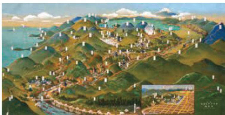
箱根・小田原交通鳥瞰図(嶺華画・昭和18年)

大正時代から昭和初期にかけての「大観光時代」。観光客の誘致のために、まるで鳥の目で眺めたようなアングルで富士山周辺の観光地を描いた鳥瞰図の肉筆原画が一堂に会します(初公開含む)。色鮮やかな鳥瞰図から、観光地としての富士山の姿を探ってみませんか。