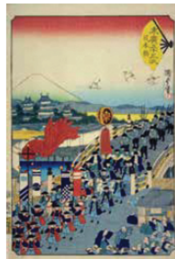
歌川派合作「東広五十三次」のうち「日本橋」(二代歌川国貞画)

歌川貞秀・月岡芳年ほか歌川派合作による揃物『東広五十三次』『御上洛東海道』など14代将軍徳川家茂の上洛や長州征討関係の錦絵、東幸をはじめとする明治天皇関係の錦絵や石版画を集成し、めまぐるしく転回した幕末から明治期の政治・社会における富士山のイメージとその象徴性について、徳川家茂、和宮、明治天皇—国事を担った若者たちの“移動”に焦点をあて再考する。さらに幕末期の一大“政治事件”だった将軍家茂と和宮の婚礼を飾った華麗な調度や絵画類を、旧徳川将軍家(徳川記念財団)秘蔵のコレクションから選りすぐって展示する。