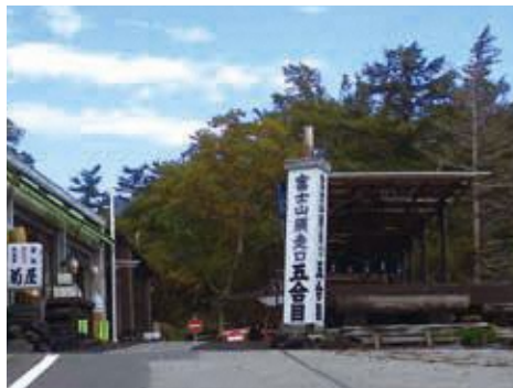
富士山須走口登山道 あざみライン新五合目

富士山の各登山道にある「合目」の標記。各登山道の各合目の標高は同じではないことを知っていますか？また同じ登山道でも時代によって各合目は付け替えられているのです。謎!? の多い富士山の「合目」のハナシ、誰かにきくと話したくなるトリビアを学びましょう!!