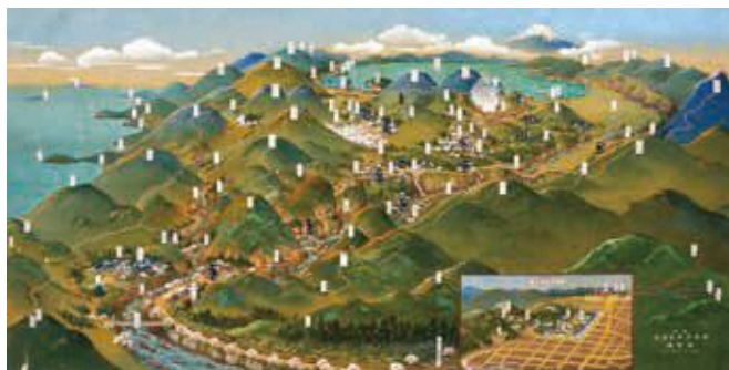
箱根・小田原交通鳥瞰図(嶺華画・昭和18年)

大正時代から昭和初期にかけての「大観光時代」。観光客の誘致のために、まるで鳥の目で眺めたようなアングルで富士山周辺の観光地を描いた鳥瞰図の肉筆原画が一堂に会します(初公開含む)。色鮮やかな鳥瞰図から、観光地としての富士山の姿を探ってみませんか。