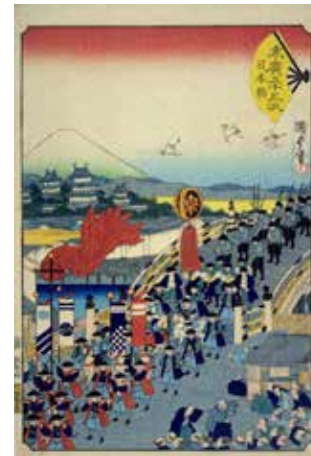
歌川派合作『末広五十三次』のうち「日本橋」(二代歌川国貞画)

歌川貞秀・月岡芳年ほか歌川派合作による揃物『末広五十三次』『御上洛東海道』など14代将軍徳川家茂の上洛や長州征討関係の錦絵、東幸をはじめとする明治天皇関係の錦絵や石版画を集成し、めまぐるしく転回した幕末から明治期の政治・社会における富士山のイメージとその象徴性について、徳川家茂、和宮、明治天皇ー国事を担った若者たちの“移動”に焦点をあて再考する。さらに幕末期の一大“政治事件”だった将軍家茂と和宮の婚礼を飾った華やかな調度や絵画類を、旧徳川将軍家(徳川記念財団)秘蔵のコレクションから選りすぐって展示する。