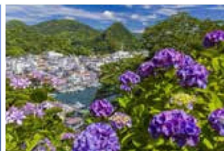
秀景ふるさと富士部門グランプリ 「初夏の公園から」岩本康裕氏 (下田富士／一岩山、撮影地：静岡県)