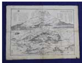
富士山須山口略絵図 (裾野市立富士山資料館蔵)

※各企画展タイトルは変更になる可能性があります。詳細は公式HPでお知らせします。