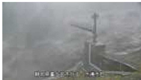
右：監視カメラが捉えたスラッシュ雪崩 (2024年4月9日)

共催：富山県立山カルデラ砂防博物館 (予定) 協力：石川県立自然史資料館 (予定) 他