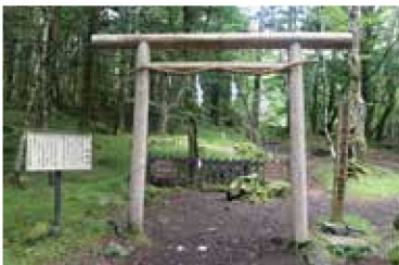
須山口登山道 (須山御胎内)

当センター・裾野市・御殿場市では、須山口登山道・御殿場口登山道について、令和3年度から同6年度まで調査を実施しました。その成果は令和7年3月に『富士山巡礼路調査報告書』として刊行しましたが、この企画展では共同調査の成果をお知らせいたします。