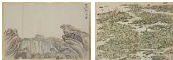
左：谷文晁筆 徳川家斉評語 富士山中真景全図 寛政7年(1795) 当センター蔵 右：葛飾北斎画 東海道名所一覽 文政元年(1818) 当センター蔵

徳川家斉は一橋治済の子(徳川吉宗の孫)として生まれ、10代将軍家治の養子となったのち、天明7(1787)年に11代将軍を襲職しました。家斉の将軍在位は、大御所在任期を含めると50年を超えます。“大御所時代”ともいわれる家斉の治世は、極点に達した将軍権力のもと泰平を謳歌した輝かしい時代であり、その御威光はときに富士山の姿に重ねられました。本展では将軍政治として江戸文化のピークを築いた徳川家斉の治世について、葛飾北斎や谷文晁、酒井抱一そして狩野家の御絵師たちなど同時代に生きた画家たちによる富士山絵画を通して回顧します。