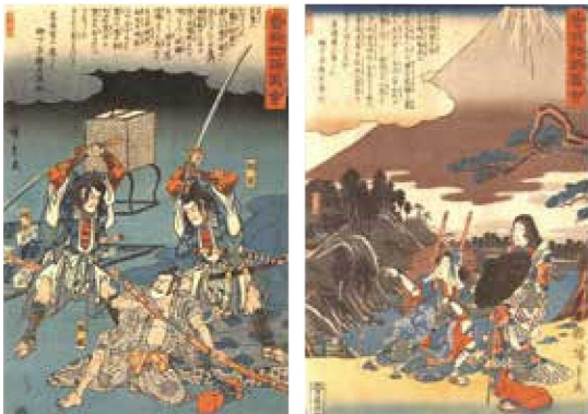
曾我物語図会 (当館蔵)

富士山にゆかりのある古典文学の一つに『曾我物語』があります。本企画展では、錦絵や屏風絵などの絵画作品とともに『曾我物語』の世界にふれ、物語の構成や絵画化の展開、富士山周辺の土地との関係などについて考えます。